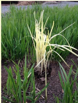
(一番黄色くなった物)

活性化センターのニラを一部遮光し黄ニラを作ってみました。黄ニラは私の出身地である岡山県で全国の7割を生産しているそうで、通常のニラに比べ柔らかく、甘さと強い臭いがないのが特徴です。青ニラの中に黄ニラがあるととてもきれいに見えます！